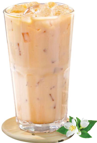
Oolong Milch Tee