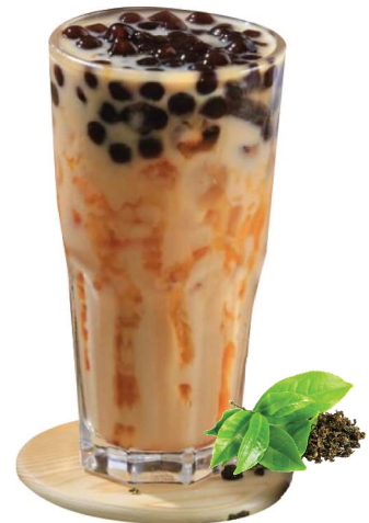
Karamell Milch Tee