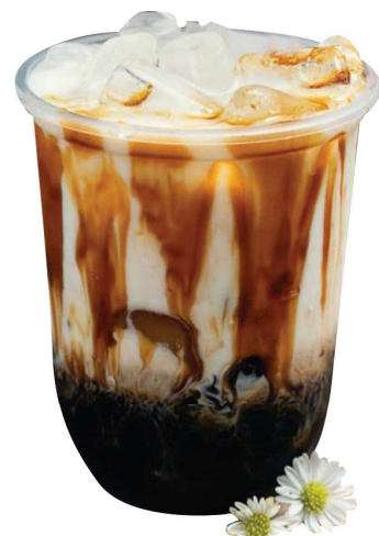
Brown Sugar Tapioca Milch Tee