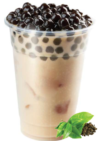
Classic Milch Tee

>> Topping müssen extra bestellt werden + 0,50€