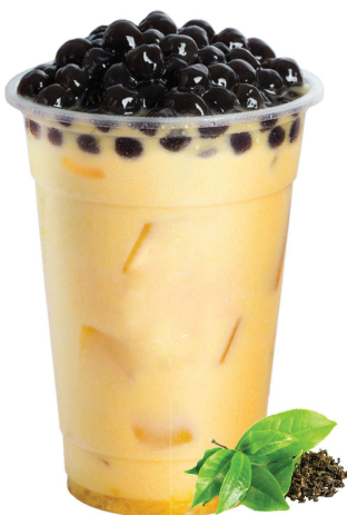
Jasmine Grüner Milch Tee