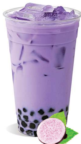
Taro Milch Tee