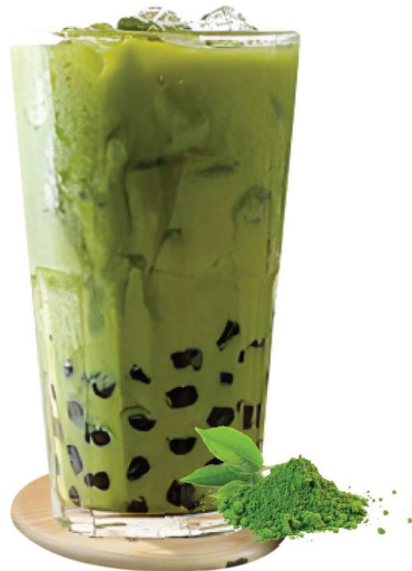
Matcha Milch Tee