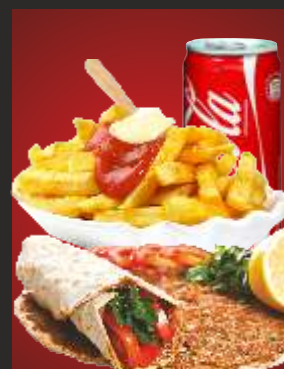
MENÜ 6 Lahmacun mit Döner + Pommes + Getränk 13,00€