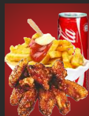
MENÜ 3 Chicken Wings b + Pommes + Getränk 12,00€