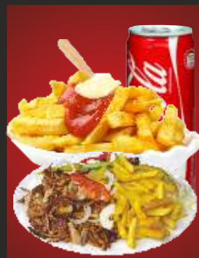
MENÜ 5 Döner Teller + Pommes + Getränk 13,00€