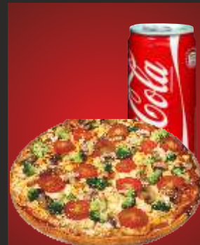
MENÜ 7 Pizza ø28 cm nach Wahl + Getränk 13,00€

Zusatzstoffe: 1= mit Farbstoff(en), 2= mit Konservierungsstoff(en), 3= Antioxidationsmittel(n), 4= mit Geschmacksverstärker(n), 5= geschwefelt, 6= geschwärzt, 7= mit Phosphat, 8= mit Milcheiweiß, 9= koffeinhaltig, 10= mit Säuerungsmittel, 11= mit Süßungsmitteln, 12= enthält eine Phenylalaninquelle, 13= hergestellt aus Kuhmilch, 14= mit Stabilisatoren * = Formfleischvorderschinken* aus Vorderschinken* Teilen zusammengefügt, mit Konservierungsstoffen, Geschmacksverstärker & Antioxidationsmittel