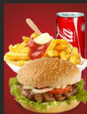
MENÜ 1 Hamburger + Pommes + Getränk 11,00€