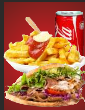
MENÜ 4 Döner Tasche + Pommes + Getränk 12,00€