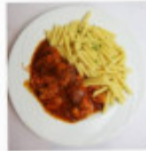
Entrecôte de boeuf sauce poivre vert avec frites Fr.32