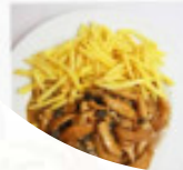
Filets de perches avec légumes. Fr.30.