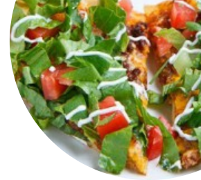
Tavola Calda Etna Speisekarte