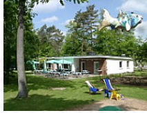
Sommerhaus main image