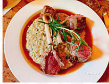
Da Claudio main image